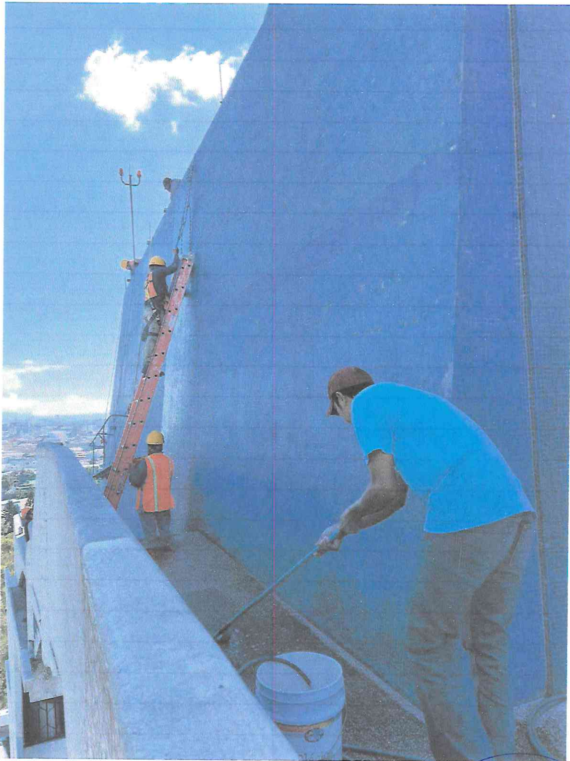
Trabajos de limpieza y desinfección en teselas y piso de granito, en segmento A1 de fachada oriente.