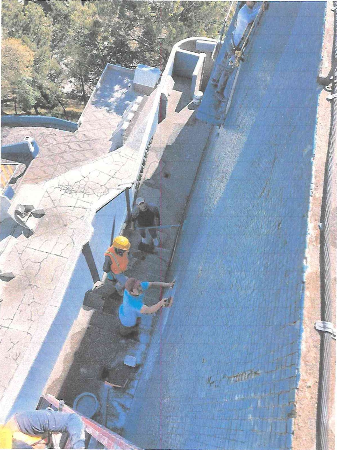
Limpieza y desinfección en tesela color verde y azul en segmento A1.